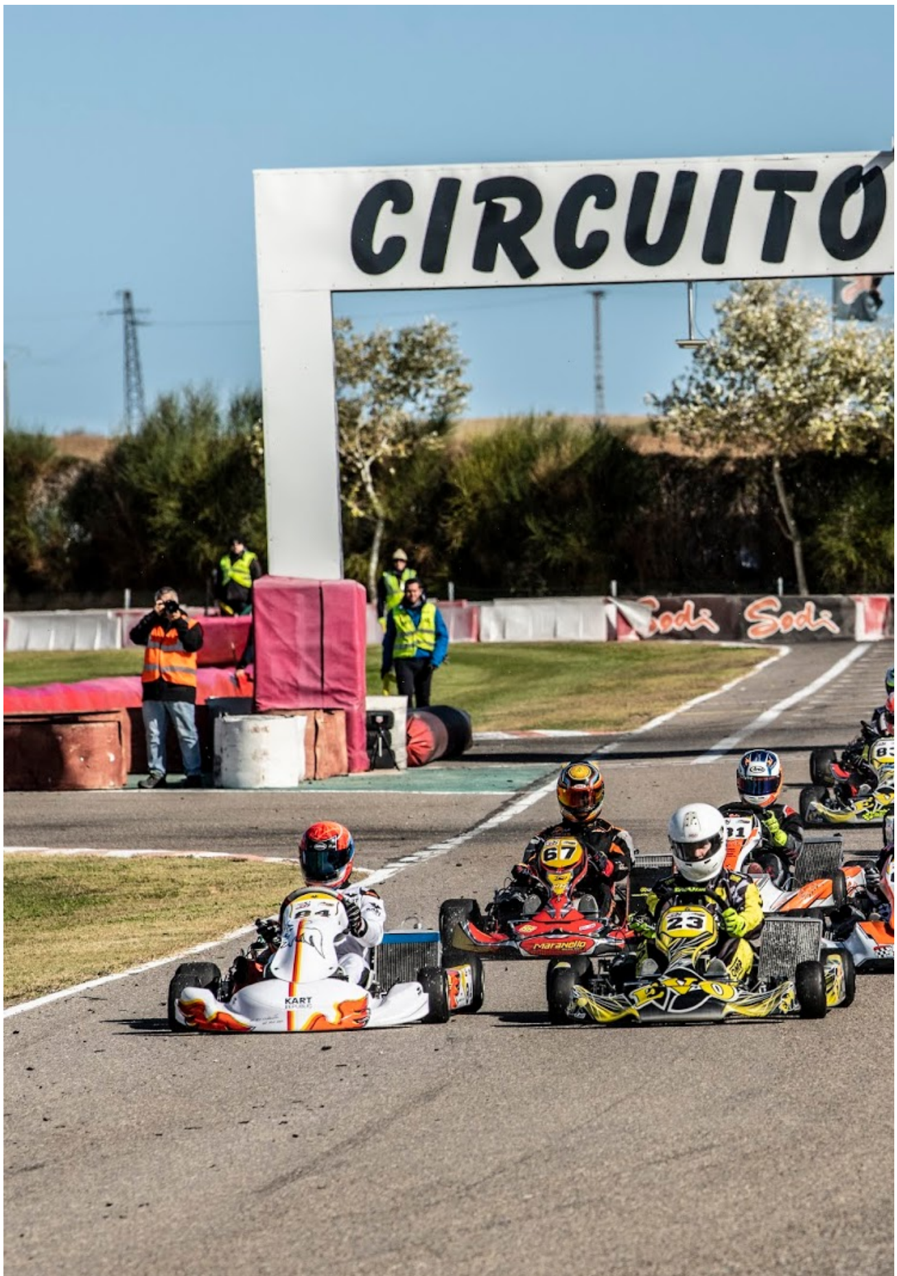
Races La Copa Aragón de karting arrancó con la Promokart e. Zuera