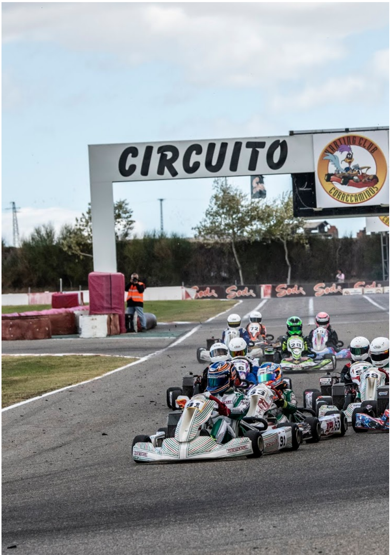
Races CKCV 2020: primeros ganadores del año en el Fast Circuit de Chestre