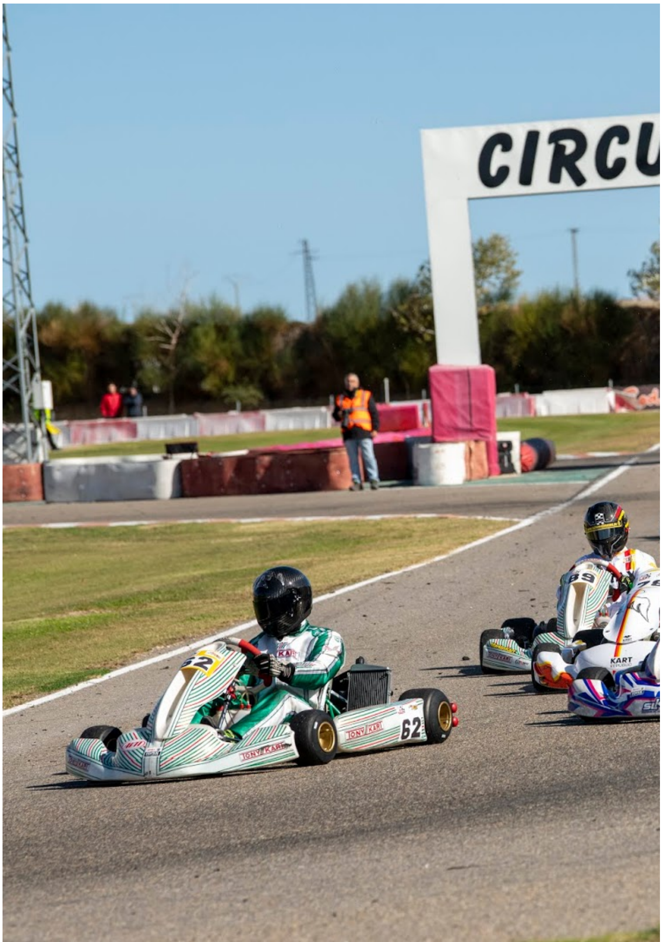
El catalán de karting arrancó en el Circuit de Juneda. 24/02/20