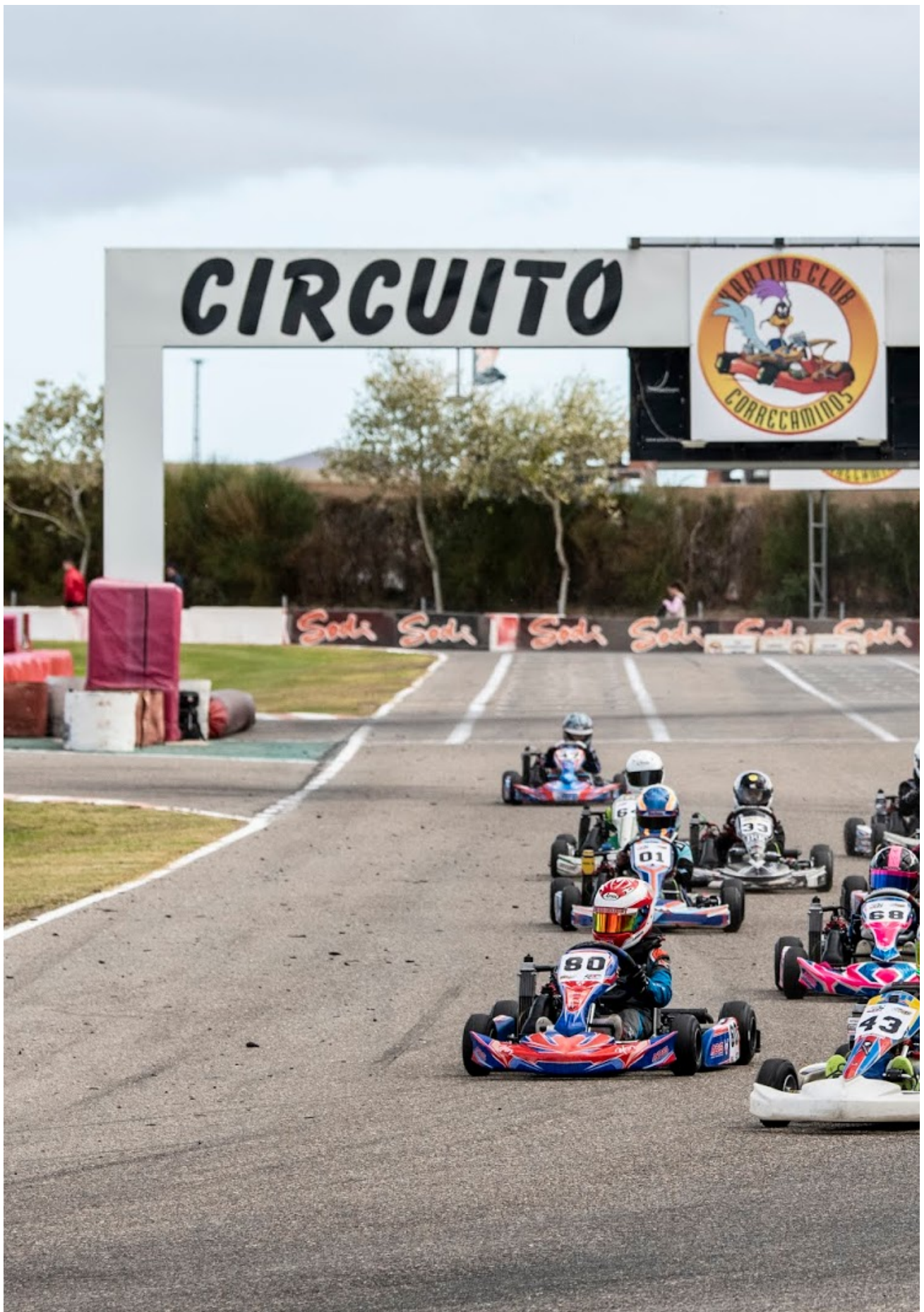
Carrera 2 Cadete