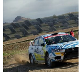
Victoria de Sosa-Pérez en C monomarca se decide en